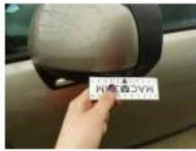
Coffre, Bosse(s), Acceptable